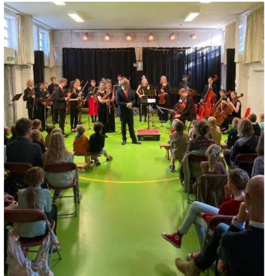
2 Het HJSO op de Haydnschool

Daarnaast geeft het Haydn Jeugd Strijkorkest elk jaar een educatief concert op een basisschool. Tijdens deze concerten leggen we veel uit over de instrumenten, het orkest en de muziek, maar wordt vooral ook het plezier van samen muziek maken benadrukt. Zo speelde het orkest vorig jaar op de gelijknamige Haydnschool. Het programma sprak tot de verbeelding van de leerlingen en hun ouders. Dansende beren en een aangeschoten altvioliste in Bartók's 'Slightly Topsy', een wedstrijdje 'wie het stilst kan luisteren' (de ouders verloren), college over hoe varkensdarmen worden gebruikt voor snaren, en de bouw van strijkinstrumenten waar geen spijker of schroef aan te pas komt: oftewel een leerzame avond. De orkestleden en leerlingen hebben van elkaar genoten en elkaar geïnspireerd met prachtige muziek, maar ook met de verhalen en informatie over de muziek.